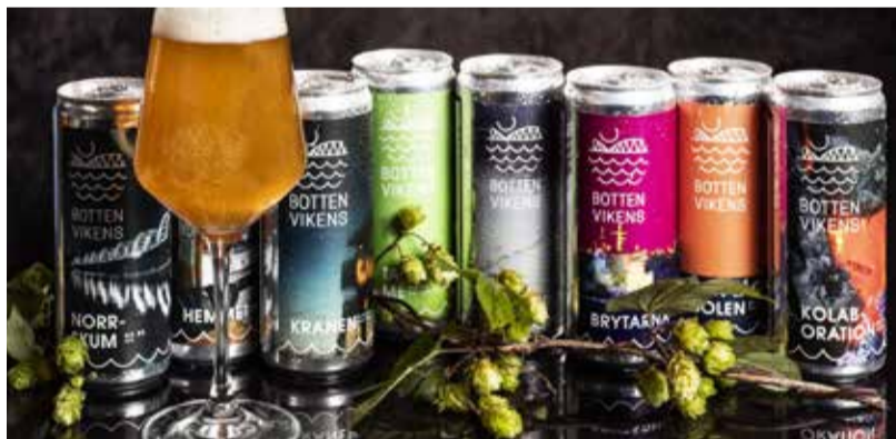
Ett kreativt varumärkesbyggande med lokalt förankrad öl, smart av Bottenvikens Bryggeri.